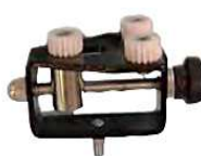
PORTAMODELOS T230 Opcional