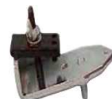
PORTAMODELOS T240 Opcional